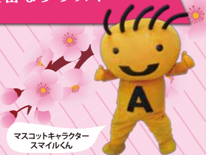
マスコットキャラクタースマイルくん

※受講回数4回の月もございます。※冷は6月度~9月度は熱中症防止の為、冷房を使用しています。別途月額300円をご負担いただきます。※すでに定員に達しているクラスもございますので予めご了承ください。定員クラスはキャンセル待ちで受け付けいたしますので、お問い合わせください。