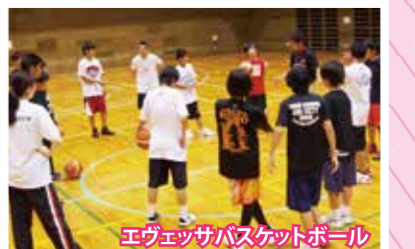
エヴェッサバスケットボール