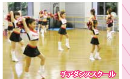
チアダンススクール