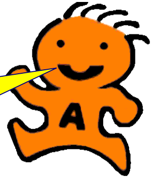
マスコットキャラクター 「スマイルくん」