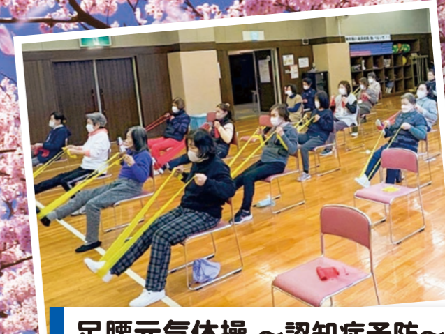
足腰元気体操～認知症予防～