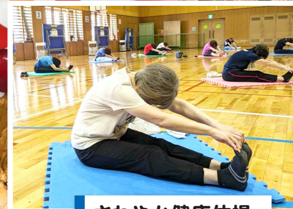
さわやか健康体操