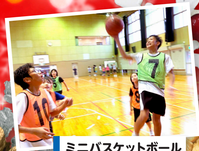
ミニバスケットボール