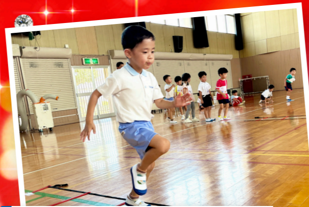
ようじのチャレンジスポーツ