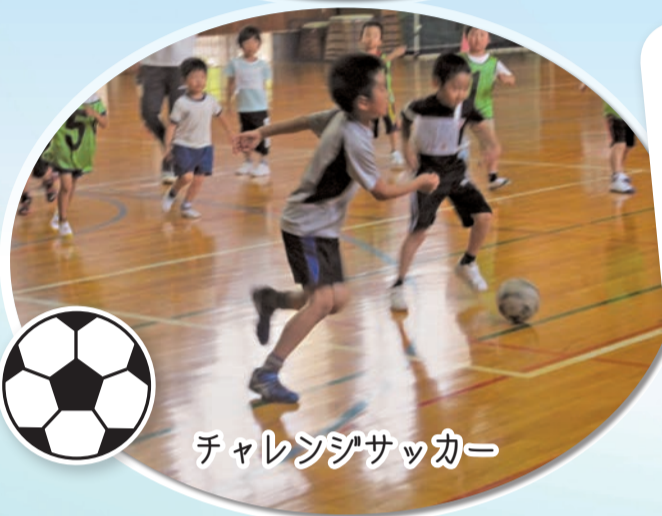
チャレンジサッカー