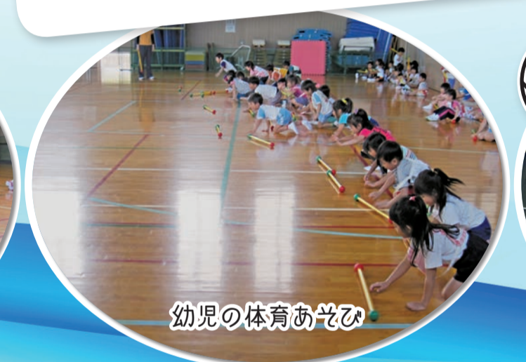
幼児の体育あそび