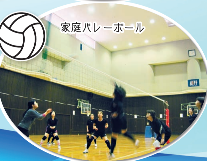
家庭バレーボール