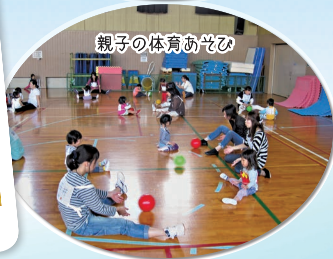
親子の体育あそび