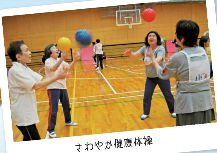
さわやか健康体操