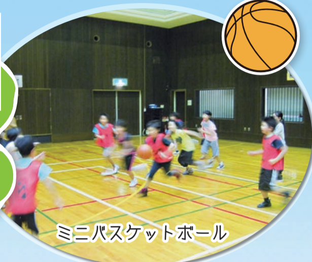
ミニバスケットボール