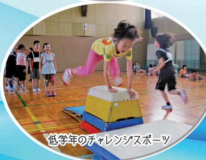
低学年のチャレンジスポーツ