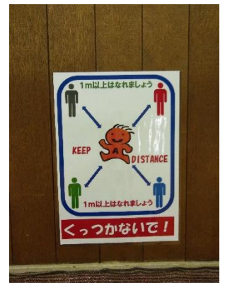
注意喚起ポスターの設置