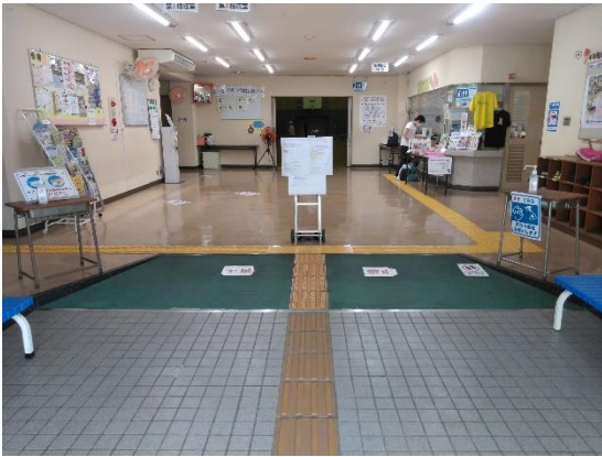
館内入口にアルコール消毒液の設置