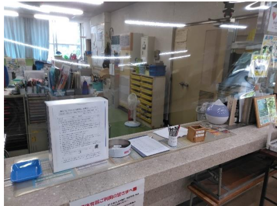
受付窓口に飛沫防止シートの設置