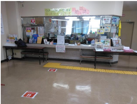
ソーシャルディスタンス確保の為の表示の設置