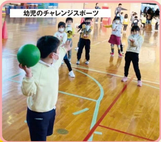
幼児のチャレンジスポーツ