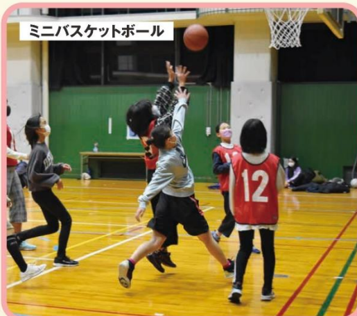
ミニバスケットボール